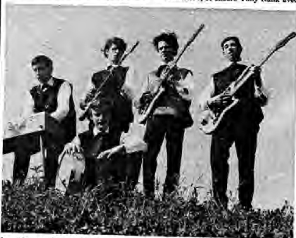
Les Aiglons, il y a bien, bien longtemps...

C'était le temps où Dalida chantait les charmes vaguement orientaux de « Mustapha » et celui aussi de « Salut les copains » sur Europe 1. En mars 1960, Johnny Hallyday avait sorti : « T'aimer follement » et « Souvenirs, souvenirs » et au Golf Drouot on parlait